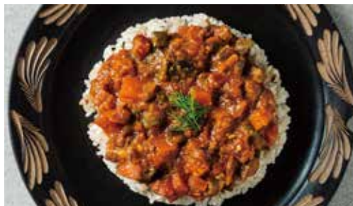
島やさいの ベジキーマ・カレー 1780

県産有機雑穀で作った満足系ヴィーガンミート!波照間島産のオーガニック高キビ、旬のグリル野菜、コクのあるトマト味噌ソースのベストマッチ!