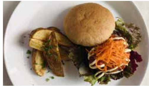
ハーベスト ミート・バーガー 1680

浮島ガーデンオープン以来の定番メニュー!30年以上無農薬有機の西表島安心米 & 無農薬有機野菜使用