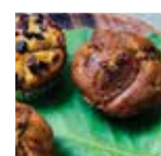
本日の ヴィーガンマフィン 450