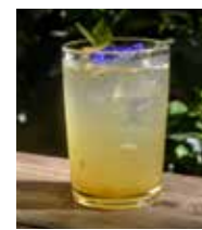
Homemade Ginger Ale 自家製ジンジャーエール +150