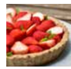
本日の ヴィーガン・パイ 650 / 1 ピース