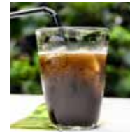
Detox Hemp Cola 麻炭デトックスコーラ