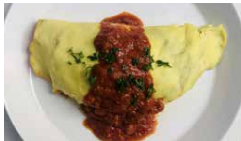
島豆腐の ヴィーガン・オムライス 1780

お魚以上の、美味しい驚き!雑穀のヒエと県産山芋で作った自家製精進お魚フライに特製ヴィーガンタルタル、全粒粉のパンズで大満足な一品に!