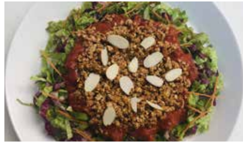
島豆腐の ベジタコライス 1680

浮島ガーデンオープン以来の定番メニュー!30年以上無農薬有機の西表島安心米 & 無農薬有機野菜使用