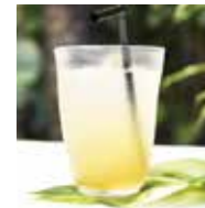
Organic Okinawa Citrus Soda シークワサー・スカッシュ (ノンシュガー)