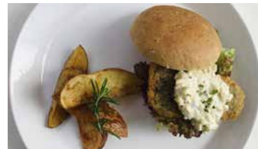
ヴィーガン・ フィッシュ・バーガー 1680

沖縄の夏の定番!久高島のハダカムギや波照間島のアマランサスに、オーガニックスパイス、自家製おから味噌が入った最幸なカレー!